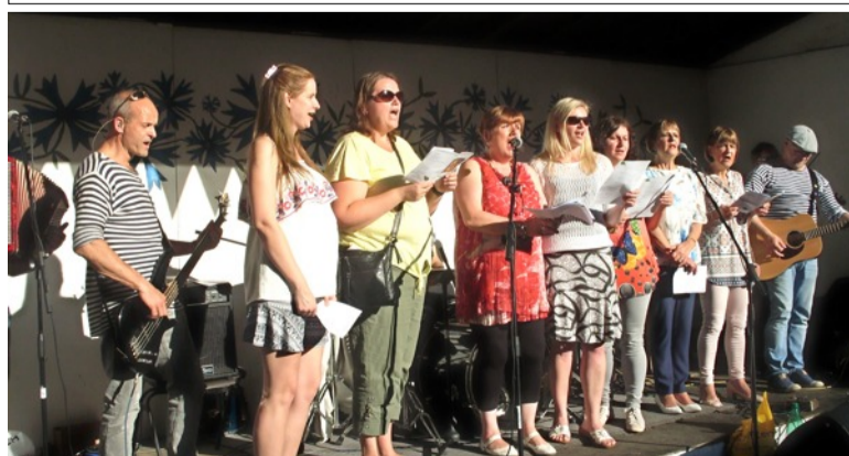
Vanaviisi saatmas ühislaule Bradfordis