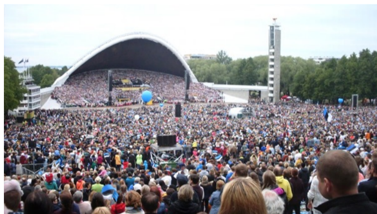
Vabariigi Presidendi kõne

Hea Eesti rahvas, hea laulurahvas, hea tantsurahvas! Tänu teile on see nädal Eestis täis rõõmu. Rõõm on tugevam kui vihm. Rõõm on tugevam kui torm. Veel enamgi – rõõm on vapram kui hirm. Noorte laulurõõm on meie tulevaste üldlaulupidude rõõm. Rahvatants elab me koolides, sest alati on tulemas tantsupidu. Nagu vanasõna ütleb, see viis, mis noorelt õpib, see vanalt peab. Olge uhked ja olge rõõmsad, sest ainult rõõmus inimene on enesekindel ja lahke. Meil on andmisrõõm. Loomisrõõm. Avastamisrõõm. Lenduminemise, tagasitulemise ja taaskohtumise rõõm. See kõik kokku, see on elurõõm.