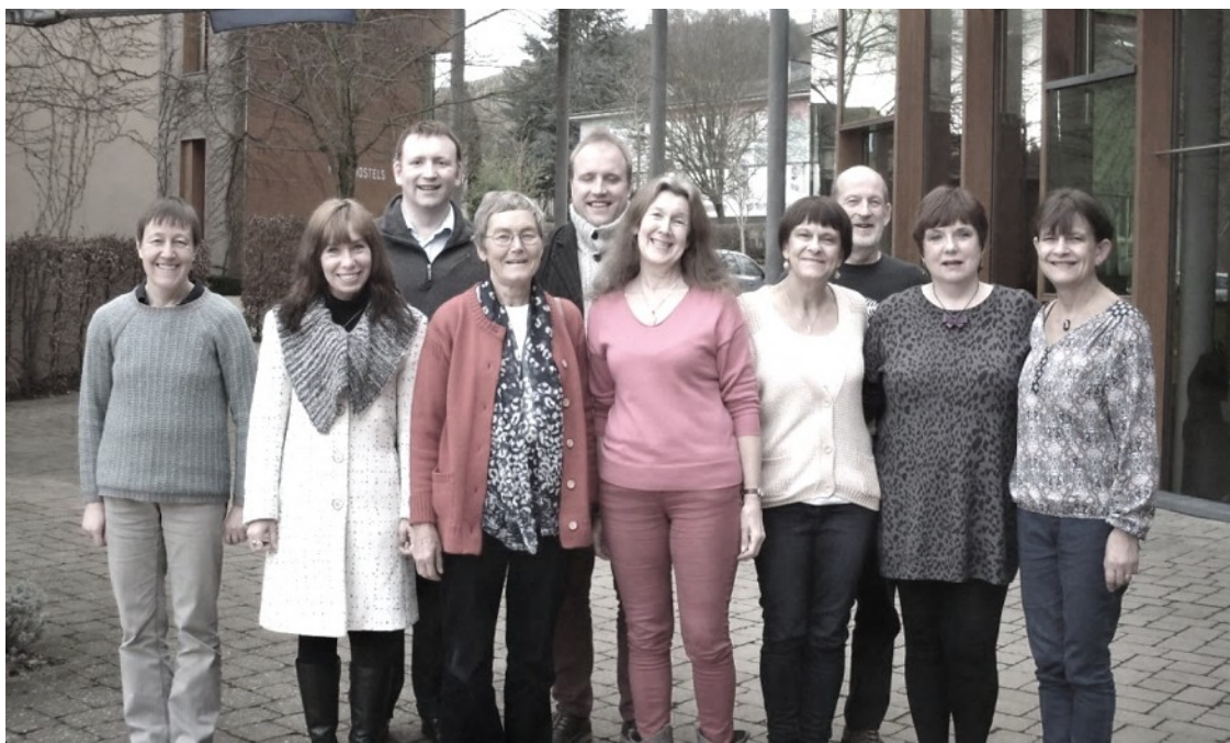
'Inglismaa' kontingent laagris

üks väike inimene minu ja meie elu muuta. Augustis 2006 tulid Haapsalus Valge Daami etenduse lavalt maha, pakkisin oma väga suure kõhu autosse ja pooleteise kuu pärast sündis Luksemburgis teine tütar. Kuna elu selles väikeriigis ei ole just odav, kolisime 2008. aasta kevadel üle piiri Saksamaale ning püüame seal hoole ja armastusega ühte vana maja korda teha. Tunnen end aga ikka rohkem Luksemburgi eestlasena. Ja ega ma eriti ei tajugi, et välismaal elan - kõik mu